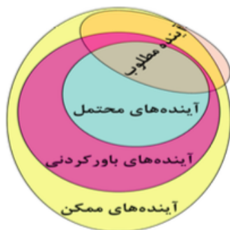
شکل ۱. انواع آینده از منظر آینده‌پژوهی (حیدری ۱۳۹۲)

آینده‌پژوهی در وهله نخست می‌کوشد تا براساس رویکردهای اکتشافی آینده‌های بدیل را کشف و شناسایی کند، در این رویکرد هنجارها و ارزش‌ها جایی ندارند و انسان به‌صورت منفعل برخی از آینده‌های محتمل را پیش‌بینی می‌کند. آینده‌پژوهی آینده را متعین، محتوم و قطعی نمی‌داند، بلکه آن را بدیل تصور می‌کند. آینده‌های بدیل حالت‌هایی از آینده است که با توجه به شدت و ضعف عوامل سازنده آنها، می‌توانند به‌صورت جایگزین هم پدید آیند. آینده‌پژوهی با رویکرد هنجاری و ارزشی از بین آینده‌های بدیل به آینده‌های مطلوب و مرجح می‌اندیشد و در واقع ساخت و معماری آینده‌های دلخواه و مطلوب را مدنظر دارد (شکل ۱).