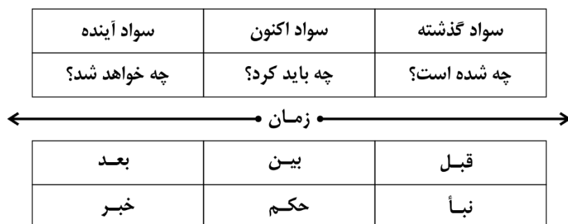
شکل ۲. تطبیق انواع سواد در محور زمان با بیان امیرالمؤمنین علیه السلام

چنان که روشن شد، سواد کارکردی، سواد مهارت پایه است و از همین رو، سواد آینده به معنای مهارت به کارگیری آینده، مهارتی جدی برای زندگی در روزگار پیچیده‌ی امروز است. انسان ایرانی، در مقام کنش‌گری و عاملیت تمدنی، آرمان و سودای تمدن نوین اسلامی را در سر دارد و لازمه چنین آرمانی، تجهیز به سواد آینده است و حالا که انسان ایرانی، در طلیعه قرن جدید خورشیدی، قرن پانزدهم، قرار گرفته است، به نظر می‌رسد که برای زندگی جهان‌گرا و عاملیت در مقیاس تمدنی، باید به مهارت و قابلیت سواد آینده مسلط و مجهز بشود.