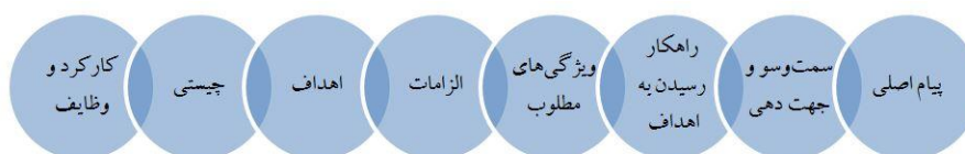
شکل ۲. رئوس اصلی موضوع رسانه در بیانات مقام معظم رهبری

برای فهم دقیق‌تر بیانات مقام معظم رهبری مضامین سازمان دهنده در شکل ذیل می‌آید: