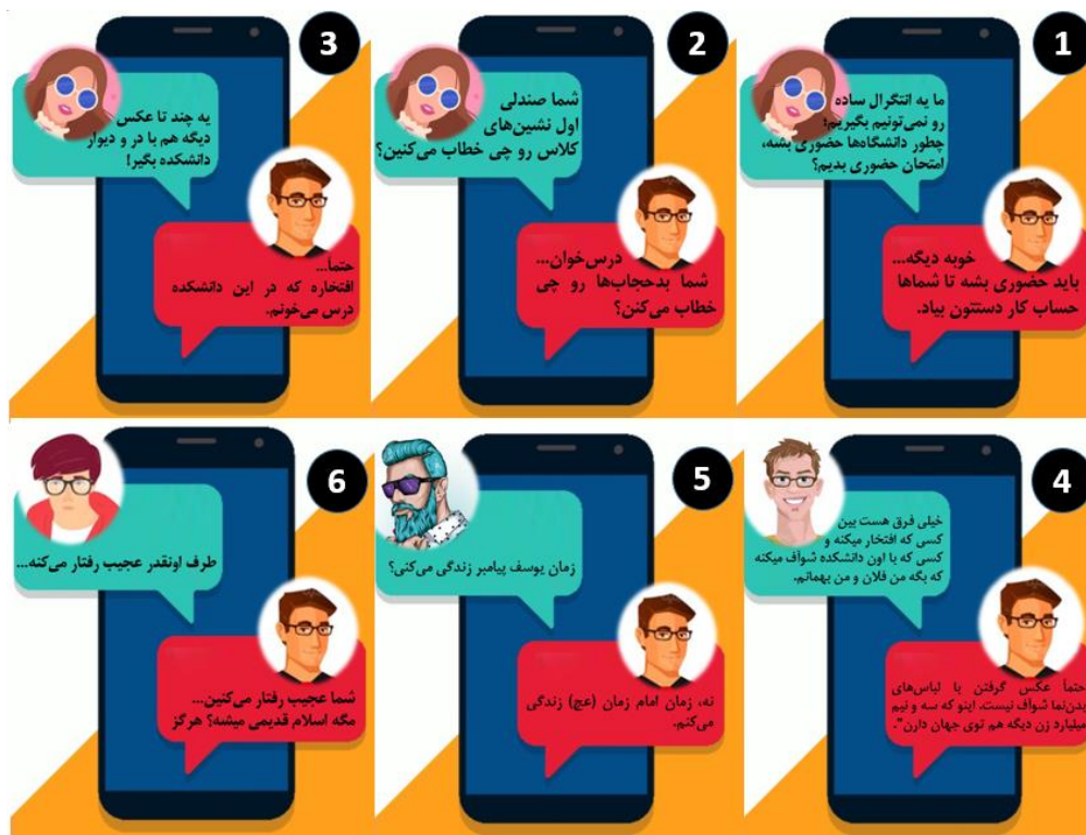
شکل ۳. مطالب مطرح شده توسط فرد منتقد در طول هشت ساعت مباحثه

پیام‌ها و عمدتاً پس از اتمام صحبت‌های ایشان ارائه شده است. ۱ همان‌طور که در بخش روش گفته شد، در خلال مباحث مربوط به حضوری شدن کلاس‌ها و امتحانات، یکی از دانشجویان ممتاز که حسب ظاهر، از اعتقادات و عرق مذهبی نیز برخوردار بود، در مقام نهی از منکر یا دفاع از حیثیت خود، نقدی سؤال‌گونه را بر پوشش (براساس تصویر پروفایل) یکی از کاربران خانم وارد می‌کند و این موضوع، زمینه ورود دیگر دانشجویان را نیز به وجود می‌آورد.