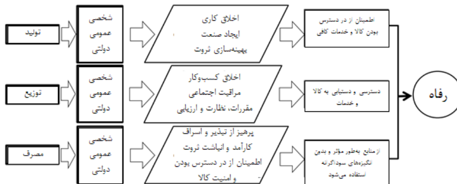
شکل ۱. مدل مفهومی مقاله «فلسفه و تأیید اعتبار عدالت رفاه در اقتصاد اسلامی»