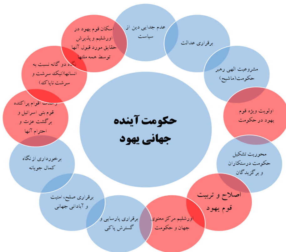
شکل شماره ۱. ویژگی‌ها و اهداف تشکیل حکومت واحد جهانی یهود در آینده

ویژگی، هفت ویژگی مشترک و شش ویژگی متفاوت می‌باشد که در شکل‌های شماره ۱ و ۲ نشان داده شده است؛ دایره‌های آبی رنگ اشتراکات و دایره‌های قرمز رنگ تفاوت در ویژگی‌ها را نشان می‌دهد: