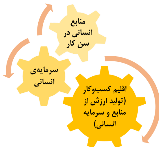
شکل ۲- زنجیره‌ی تبدیل جمعیت به سرمایه‌ی انسانی مولد و ارزش‌ساز

لذا جهت از دست نرفتن پنجره‌ی فرصت جمعیت‌نگاری، به موازات سیاست‌های افزایش نرخ رشد جمعیت، بایستی برای پیشگیری از وقوع سناریوهای «زاینده‌ویران» و «نازاویران»، (فارغ از اینکه افزایش جمعیت به چه سمتی خواهد رفت) زنجیره‌ی تبدیل جمعیت در سن کار به نیروی انسانی مجهز به سرمایه‌ی انسانی و تولید ارزش اقتصادی رشد‌دهنده و توسعه‌ی اقتصادی کشور، ساخته شود.