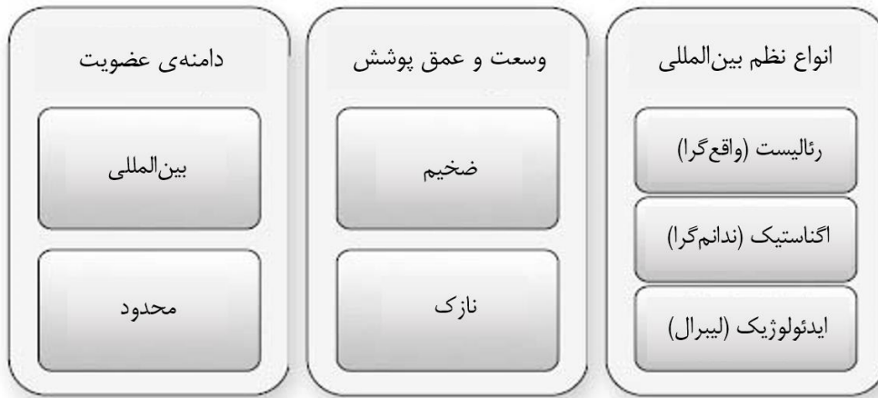
شکل ۱ - انواع نظم بین‌المللی از نظر میرشایمر

نظم جهانی، در صحنه‌ی واقعیت و روی زمین، یک سیر تاریخی را سپری کرده است و در دوره‌های مختلف، اشکال و صورت‌بندی‌های مختلفی را بر خود دیده است. سیر تاریخی نظم جهانی، در دوره‌ی پس از قرون میانه در اروپا، که بعدتر به کل جهان توسعه پیدا کرده است، در جدول زیر ارائه شده است.