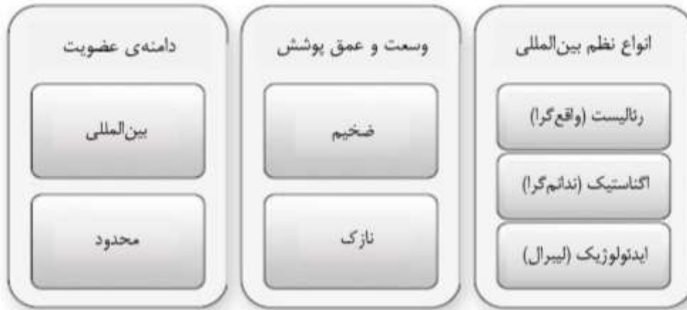
شکل ۱ - انواع نظم بین‌المللی از نظر میرشایمر

نظم جهانی، در صحنه‌ی واقعیت و روی زمین، یک سیر تاریخی را سپری کرده است و در دوره‌های مختلف، اشکال و صورت‌بندی‌های مختلفی را بر خود دیده است. سیر تاریخی نظم جهانی، در دوره‌ی پس از قرون میانه در اروپا، که بعدتر به کل جهان توسعه پیدا کرده است، در جدول زیر ارائه شده است.