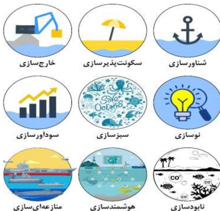
شکل ۲. کلان‌روندهای اقتصاد آبی

در نتیجه، ۶ کلان‌روند اصلی اقتصاد آبی، استخراج شد که در تصویر زیر ارائه شده است و در ادامه، توضیح کلی هر یک از این کلان‌روندها، ارائه خواهد شد.