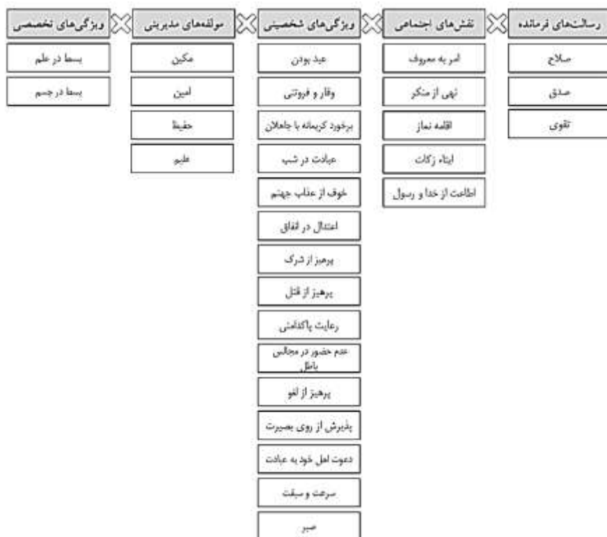
نمودار ۱: مدل تصویر مطلوب فرماندهی در آینده در سازمان‌های فرهنگی نیروهای مسلح جمهوری اسلامی ایران از منظر قرآن