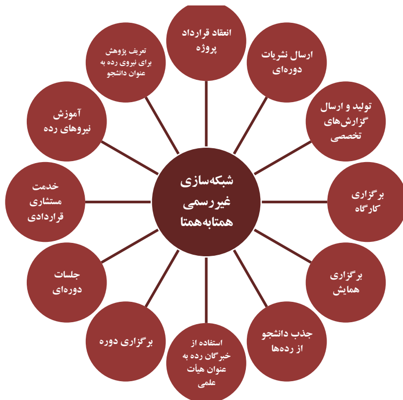
شکل ۲- نظام مکانیسم‌های انتقال تکنولوژی با محوریت شبکه‌سازی غیررسمی هم‌تا به هم‌تا (برابر)

بایستی ابتدا اجازه داده شود که افراد دو سوی هر ارتباط، به هم نزدیک شوند و اگر توانستند با هم همکاری سازنده داشته باشند، سپس سازمان‌ها ناگزیر به هم وصل می‌شوند؛ لذا ابتدا بایستی بستر ساخت شبکه روابط غیررسمی انسانی فراهم شود که مواردی مثل جلسات اخوت، همایش‌های میان سازمانی و ... شکل بگیرد تا شبکه‌سازی ارتباطی نقطه‌به‌نقطه محقق شود. نتیجه اینکه به نظر می‌رسد، مناسب‌ترین اقدام برای ارتقای انتقال تکنولوژی دانشگاه و افزایش کارایی ارتباط با بیرون و انجام خدمات مستشاری، محوریت شبکه‌سازی غیررسمی هم‌تا به هم‌تا باشد به نحوی که بقیه مکانیسم‌های رسمی و غیررسمی دیگر، مقوم و مقوی این شبکه‌سازی باشند و این شبکه‌سازی، مبتنی بر فرهنگ اخوت بومی، ساماندهی شود.